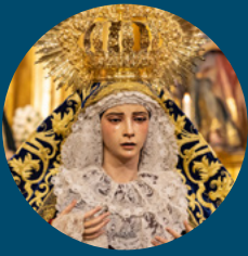
Santa Marta Boletín digital Nº 11 Sevilla, Mayo 2023