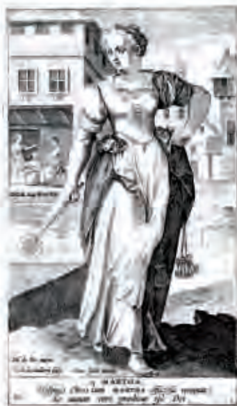
Grabado realizado por Karel Van Mallery hacia 1607.

un edificio religioso en clara alusión al monasterio fundado por la santa como asimismo se cuenta en la narración medieval. Por último, nuestra atención recaerá en el texto latino que figura en la parte inferior de la estampa, tomado del Libro de los Proverbios (31, 10) y cuya traducción sería: La mujer fuerte ¿quién la hallará? Vale mucho más que las perlas; se equipara así a Santa Marta a las mujeres fuertes o heroínas del Antiguo Testamento, sugerente tema que el arte contrarreformista explotará hasta cotas insospechadas.