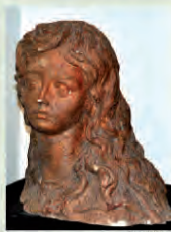
LUIS ORTEGA BRU