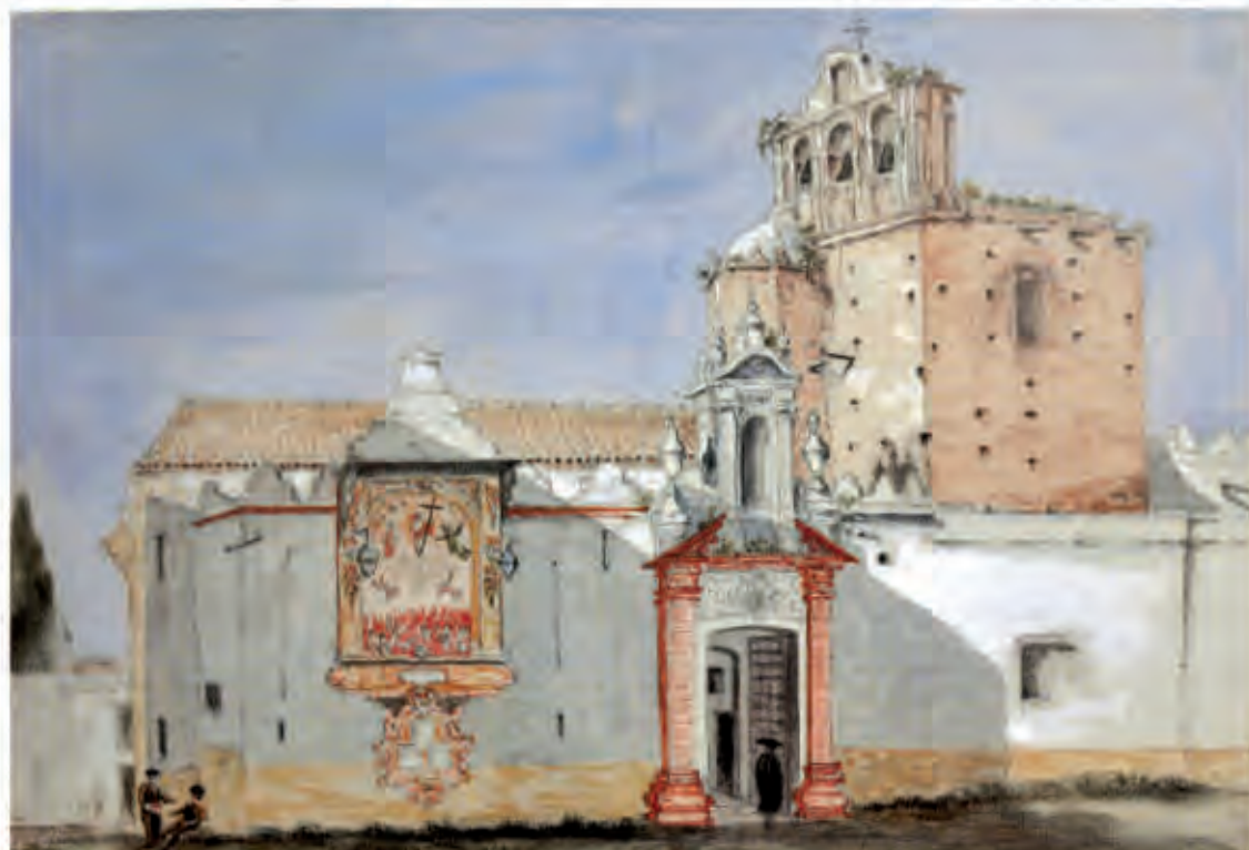
Richard Ford, Iglesia de San Andrés (1831), Londres.