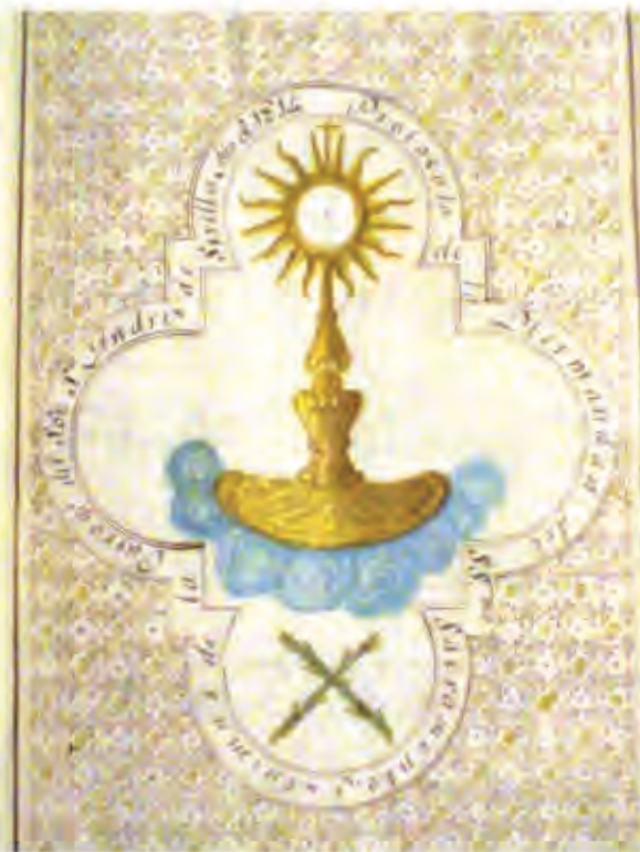
Lámina del Libro de Protocolo de la Hdad. Sacramental de San Andrés. Año 1814.

A la hora de referirse a la Hermandad Sacramental afirma lo siguiente: "La Cofradía Sacramental es también de las primeras de esta Ciudad, la cual se fundó baxo de decreto del Sr. Arzobispo D. Diego Dehesa, el año 1514, y tuvo regla el de 1584, según consta del instrumento que se halla en su archivo núm 11, y caxón 13, la que fue aprobada por el ordinario Eclesiástico, habiéndose gobernado por ella hasta el año 1787, en que obtuvo otra aprobación por el Real y Supremo Consejo de Castilla".