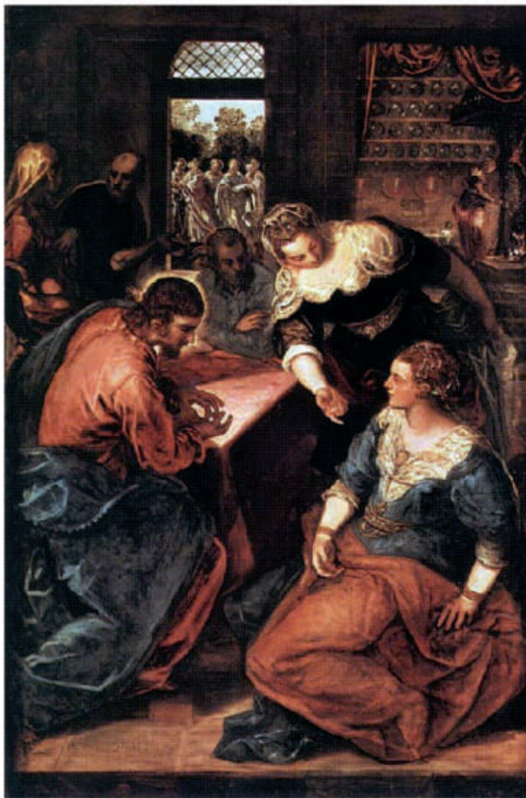
"Cristo en casa de Marta y Maria". Tintoretto (1567). Alte Pinakothek (Munich).

tenía san Pablo. De él precisamente hemos tomado el lema de nuestra Hermandad: «Charitas Christi urget nos = La Caridad de Cristo nos apremia». Pero me refiero también al servicio de la justicia. Sin preocupación por la justicia la vida cristiana pierde toda su credibilidad. Una lectura de la encíclica Caritas in veritate nos puede ayudar mucho a vivir esta dimensión esencial de la vida cristiana.