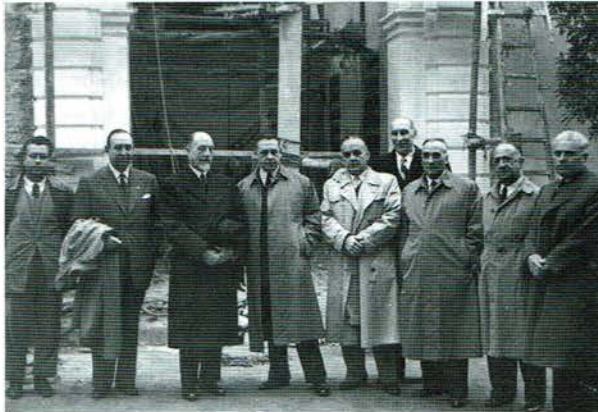
Nuestros fundadores delante de san Andrés, cuya puerta de salida de la futura cofradía aparece en construcción.

Es cierto que el tránsito del tiempo agota y quema, y hasta llega a hacer que perdamos la ilusión; pero hay algo que nada ni nadie nos podrá arrebatar: la esperanza de contemplar algún día la completa restauración de nuestra sede y a la digna ubicación de nuestros Titulares en ella con la readaptación de nuestras dependencias.