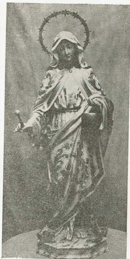
Imagen de Santa Marta a la que alude el texto.

Hermandad de SANTA MARTA. Iglesia de San Marcelo. León.