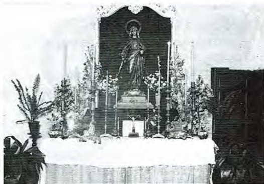
Aspecto del primer altar de Santa Marta