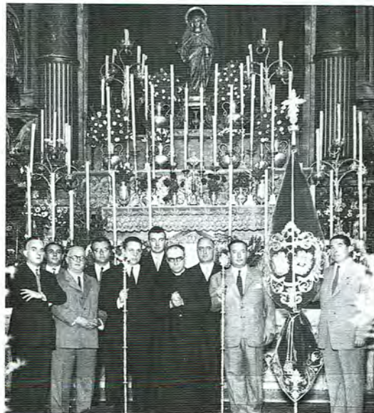
Retrospectiva de la primera Función de nuestra Hermandad

La Hermandad crece día a día, el barrio se vuelca con la Hermandad y con la acción que esta desarrolla se va tomando entidad hasta llegar a entablar diversas conversaciones con el Cardenal Segura. Todo ello, desemboca en una pregunta a la salida de uno de los frecuentes Cabildos de Oficiales celebrado en puertas de la Semana Santa de 1.948: "¿Porqué ser una Hermandad de Gloria y no de Penitencia?"