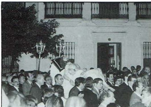
Los hermanos de Santa Marta portaron la imagen en el camino de regreso.

Antes de salir el Santísimo Cristo de la Caridad de la Catedral, se realizó estación en la Capilla Real, donde ante la imagen de nuestra Patrona la Santísima Virgen de los Reyes se cantó una Solemne Salve. Posteriormente se regresó a nuestra parroquia por idéntico camino que a la ida, portando la imagen los hermanos de Santa Marta y yendo la sagrada imagen rodeada de numerosos devotos y cofrades que acompañaron al cortejo en una noche de imborrable recuerdo. Se entró en San Andrés por la puerta mudéjar y se instaló al Señor en la Capilla, donde recibió un espontáneo besapiés de los presentes como colofón a un intenso y fervoroso día, que quedó grabado en la memoria de cuantos lo vivimos hace ahora diez años.