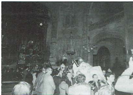
En la Capilla Real, a los pies de nuestra Patrona la Stma. Virgen de los Reyes