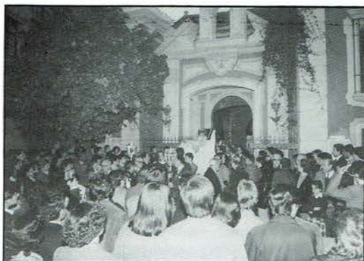
Imagen insólita del Cristo saliendo por la puerta de la Hdad.