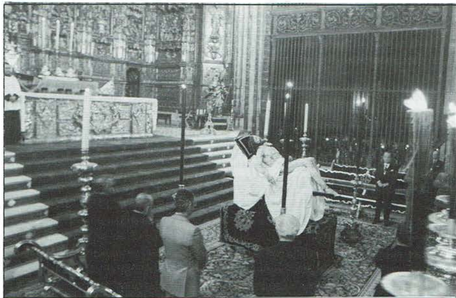
En el Altar Mayor de la S.I.C. el Stmo. Cristo de la Caridad fué el centro de las oraciones de los cofrades sevillanos.