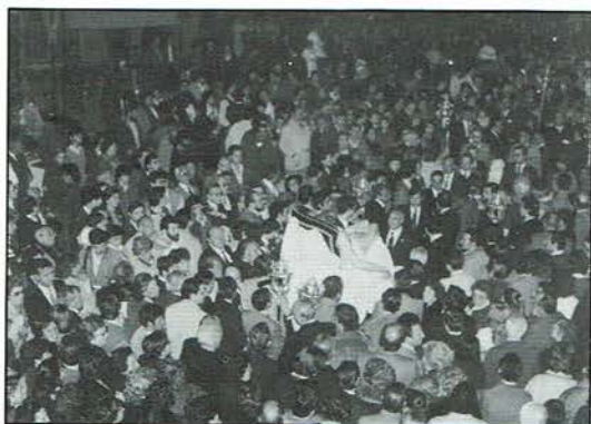
La muchedumbre de personas abarrotando la plaza del Salvador de ida a la S.I.C.